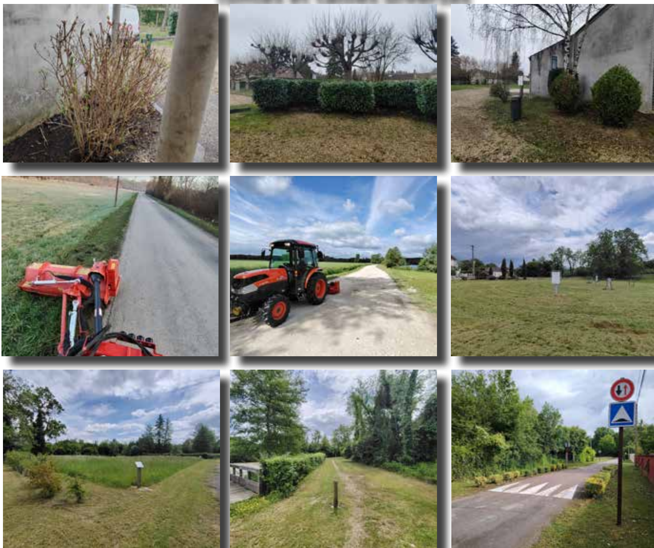
Entretiens divers autour de la salle polyvalente, au Vezoult (route et chemins) et au Portmontain autour de la mare pédagogique.