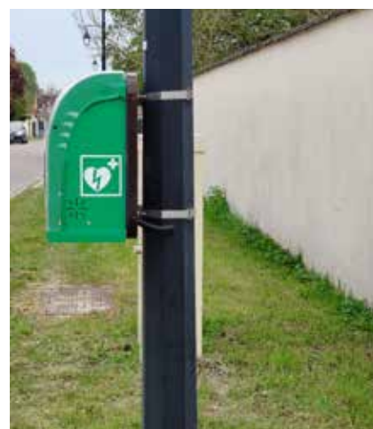
Un 2ème DAE a été installé dans notre commune, le 1er se trouve à la mairie et le second au VEZOULT.