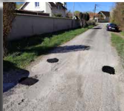
Installation d'une poubelle au parc des Arches, Tonte et rebouchage de trous sur la chaussée, rebouchage de trous à la Soline, Passage de la balayeuse dans tout le village et ses hameaux...